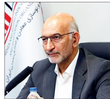
اشتراک گذاری این داده‌ها و نتایج حاصل از آن که در سامانه فوق وجود دارد، گامی در جهت ارایه اطلاعات

رئیس هیات عامل ایمیدرو گفت: سامانه اطلاعات یکپارچه مکان مبنای ایمیدرو، ابزاری در جهت توسعه فعالیت‌های اکتشافی و جبران عقب ماندگی‌های این بخش است.