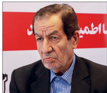
منصه ظهور می رسد.

معاون رفاه و امور اقتصادی وزارت تعاون، کار و رفاه اجتماعی اظهار داشت: طی بازدیدی که هیات کشورهای افغانستان از ذوب آهن اصفهان داشتند مذاکرات و تفاهم نامه های بسیار خوبی به امضا رسید که زمینه صادرات محصولات و استفاده از پهنه های معدنی غنی کشور افغانستان را برای ذوب آهن فراهم نموده است.