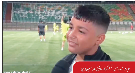
نات ذوب آهن از کادو که ماهی نام حسین

باشگاه فرهنگی، ورزشی ذوب آهن اصفهان از کودک کاری که در ساعات خلوت شب، به محضر امام حسین (ع) ارادت خود را نشان داد حمایت نمود. این کودک که تمرین تیم فوتبال باشگاه ذوب آهن اصفهان دعوت شد و در تیم ورزشی کودک کار اصفهان که توسط این باشگاه راه اندازی شده است عضویت یافت.