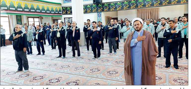
در ادامه برنامه های سوگواری در ماه های محرم و صفر و به مناسبت بیست و هشتمین و سی امین اسلام حضرت محمد(ص)، شهادت سبط نبی اکرم

حضرت امام حسن (ع) و شهادت امام زین العابدین حضرت علی بن موسی الرضا (ع) مراسم قرآنی زیارت حضرت رسول (ص) و سوگواری در مسجد الزهرا(س) ذوب آهن اصفهان برگزار شد. در این مراسم معنوی که در روز چهارشنبه ۲۲ شهریورماه و به همت شورای فرهنگی شرکت برگزار شد، جمعی از کارکنان شرکت حضور داشتند. در این مراسم حاج علی نوری مداح اهل بیت (ع) بانوای گرم خود ضمن قرائت زیارت حضرت رسول اکرم (ص) در مظلومیت و مصائب اهل بیت (ع) به ویژه پیامبر عظیم الشان اسلام (ص) و شهادت حضرت امام حسن (ع) و حضرت امام رضا (ع) مرتبه سربا نمود. شایان ذکر است که به همین مناسبت برنامه های مشابهی نیز در دیگر قسمت های کارخانه برگزار شد.