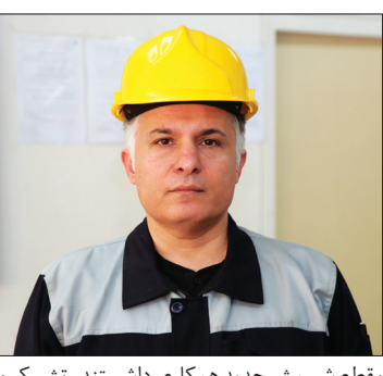
مقطع شمش جدید همکاری داشتند، تشکر و قدردانی نمود.

دارد و بر این اساس امروز تیر آهن H24 بسر پایه شمش ۳۲۰ * ۲۵۰ تولیدی بخش فولادسازی شرکت به عنوان سرآغازی جدید از بهار تولید در ذوب آهن اصفهان رونمایی شد. وی افزود: اگر کشور ایران در جایگاه دهمین تولیدکننده فولاد دنیا قرار دارد، این موفقیت مدیون مروهون ذوب آهن اصفهان است که از دیرباز تاکنون تلاشگران این شرکت مادر صنعتی در جای جای ایران زمین، در ساخت و بهره برداری از پروژه های گوناگون منبأ تحول نوآوری هستند.