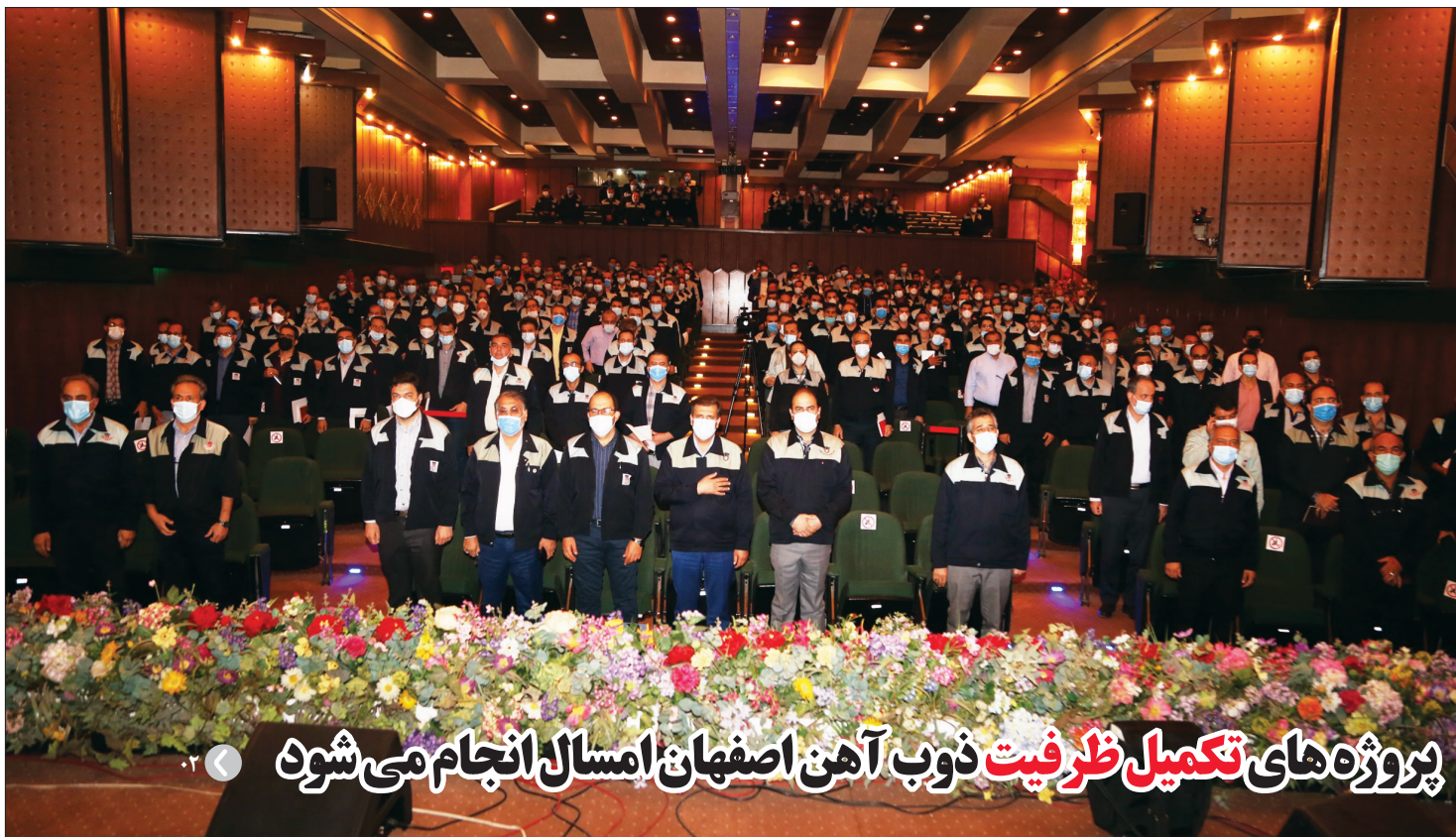
پروژه های تکمیل ظرفیت ذوب آهن اصفهان امسال انجام می شود