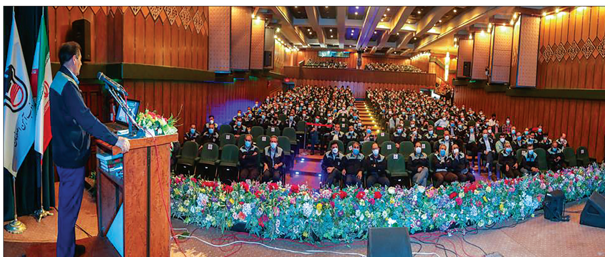
همایش راهبردی مدیران و کارشناسان ذوب آهن اصفهان با حضور مهندس ایرج رخصتی سرپرست مدیریت عامل، تعدادی از معاونین و مدیران شرکت و کارشناسان حوزه بهره برداری ۳۰ فروردین ماه در تالار آهن برگزار شد.

مواد کمکی و قطعات به ویژه مواد نسوز و غلتک، کاهش ضایعات فرایندی و کیفی در سطح واحد ها و بهبود تعمیرات و افزایش آماده به کاری تجهیزات را از دیگر عوامل موثر بر افزایش بهره وری ذکر کرد که در سال جاری باید مورد توجه جدی قرار گیرد.